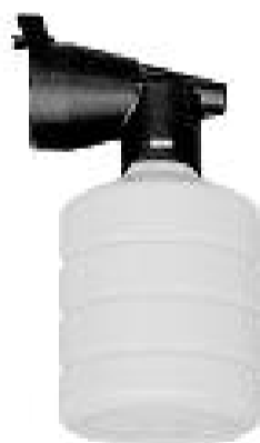
LANCIA SCHIUMA CON SERBATOIO - COD. 6.002.0358