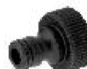
INNESTO RAPIDO 3/4 F - COD. 3.100.0082