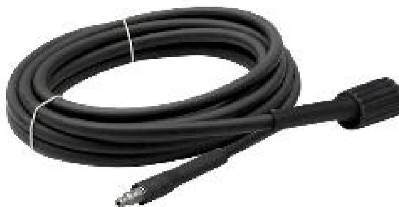
TUBO 1/4 18MPa 3M GIREVOLE M22X1,5 D.15 - INNESTO RAPIDO PER PISTOLA S'09-SY'10-S'16 - COD. 4.018.0106