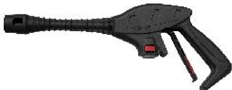
PISTOLA S'16 CON ATTACCO RAPIDO INTEGRATO - COD. 6.001.0106